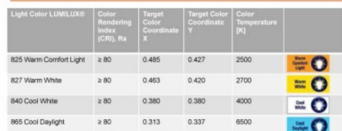
Light colors, color rendering properties and Light Color Coordinates for OSRAM DULUX® - lamps with integrated control gear

1 | Datumname | ORG CODE | Initialen Titel/Versionierung | TMM/LLJLJ