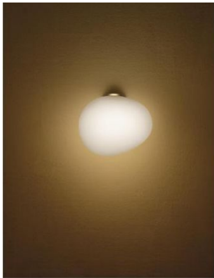
Available Versions Erhältliche Ausführungen