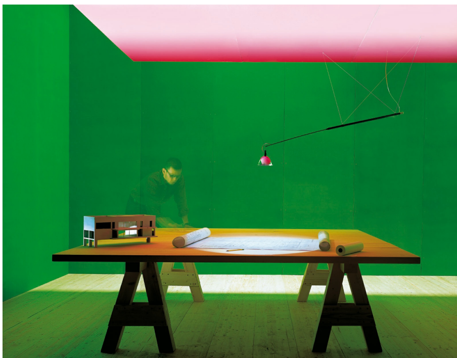
Max. Mover INGO MAURER & TEAM 2000/2017

Reinstaluminium, Metall, Fiberglas. Der Teleskopstab ist ausziehbar. Durch die Aufhängung an Nylonseilen ist Max. Mover in der Höhe zu verstellen und um 180° drehbar. Der Reflektor ist ebenfalls verstellbar.