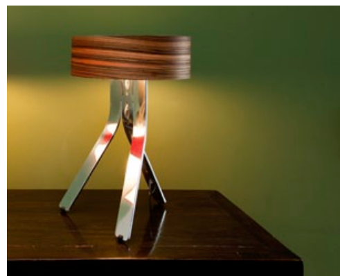
KORPUS ALUMINIUM POLIERT + ZEBRANO EDELHOLZFURNIERSCHIRM CORPUS HIGH-GLOSS ALUMINIUM + ZEBRANO EXOTIC TIMBER VENEER SHADE FIN-102 + FIN-990