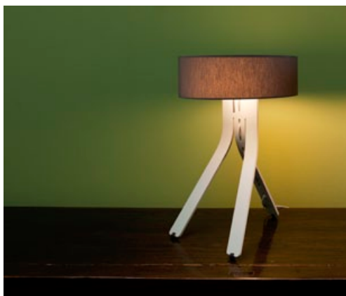
KORPUS ALUMINIUM MATT ELOXIERT + STOFFSCHIRM BRAUN CORPUS BRUSHED ALUMINIUM, MATT ANODISED + BROWN FABRIC SHADE FIN-100 + FIN-920