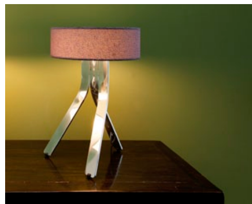
KORPUS ALUMINIUM POLIERT + STOFFSCHIRM LILA CORPUS HIGH-GLOSS ALUMINIUM + LILAC FABRIC SHADE FIN-102 + FIN-930