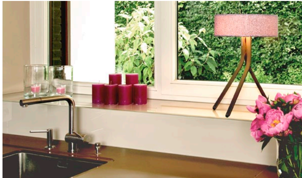
Fino – Aluminium hellbronze matt mit einem lilafarbenem Stoffschirm Fino –Aluminium light bronze corpus with a lilac fabric shade FIN-108 + FIN-930

Eine Idee - klar geformt. One idea - one clear design.