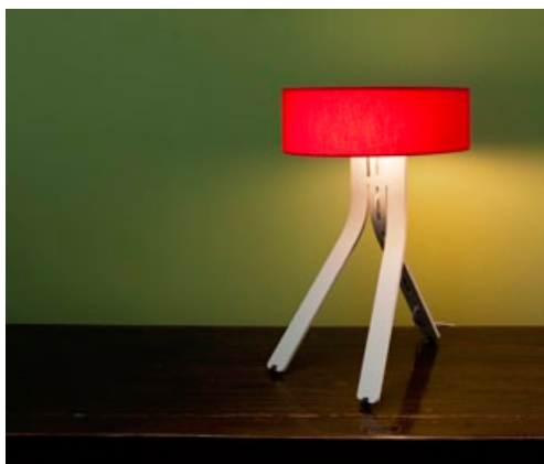
KORPUS ALUMINIUM MATT ELOXIERT + STOFFSCHIRM ROT CORPUS BRUSHED ALUMINIUM, MATT ANODISED + CORAL RED FABRIC SHADE FIN-100 + FIN-950