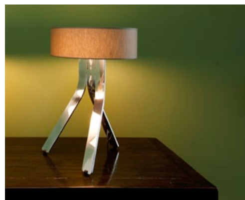
KORPUS ALUMINIUM POLIERT + STOFFSCHIRM BEIGE CORPUS HIGH-GLOSS ALUMINIUM + BEIGE FABRIC SHADE FIN-102 + FIN-910