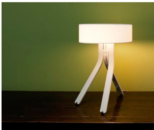
KORPUS ALUMINIUM MATT ELOXIERT + STOFFSCHIRM ELFENBEIN CORPUS BRUSHED ALUMINIUM, MATT ANODISED + PALE IVORY FABRIC SHADE FIN-102 + FIN-900