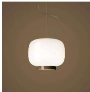
Chouchin Reverse 3