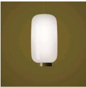
Chouchin Reverse 2