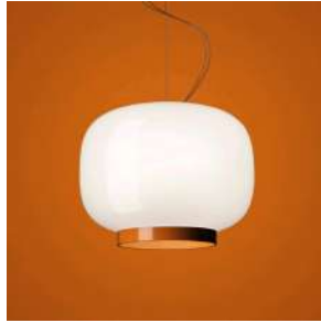
Chouchin Reverse 1