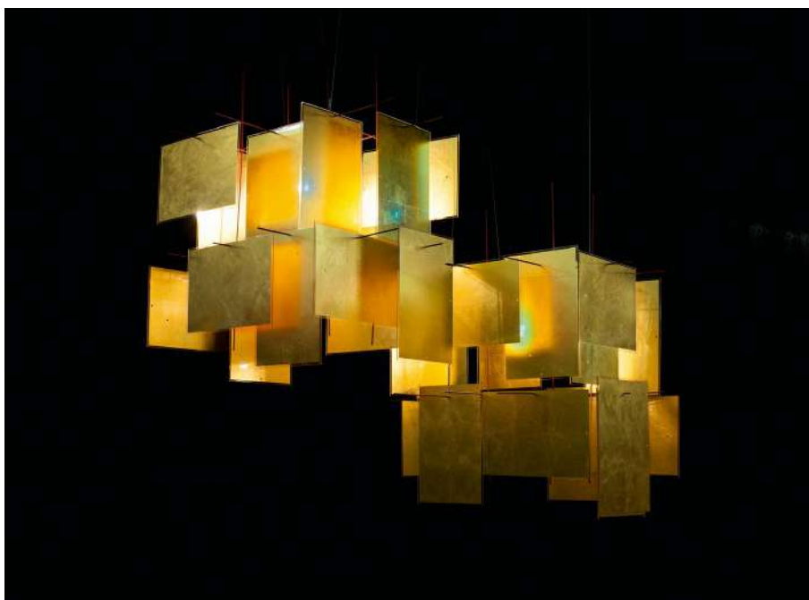
1000 Karat Blau AXEL SCHMID 2009/2016

1000 Karat Blau ist eine große, eindrucksvolle Hängelampe mit der Wirkung eines Lichtobjekts. Die Blenden aus Blattgold und Acrylglas reflektieren das Licht des Leuchtmittels hin und her, und erzeugen eine besonders warme Atmosphäre. Wie bei der kleineren 24 Karat Blau, die seit 2005 Teil der Ingo-Maurer-Kollektion ist, kann kurzwelliges blaues Licht zwischen den Molekülen hindurchleuchten. Dadurch erscheint der Glühfaden bläulich. Mit mehreren Exemplaren lassen sich große Cluster gestalten.