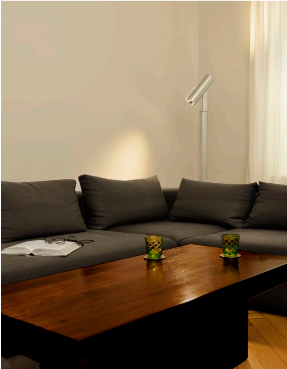
BARRONE geschliffen matt eloxiert brushed, matt anodised