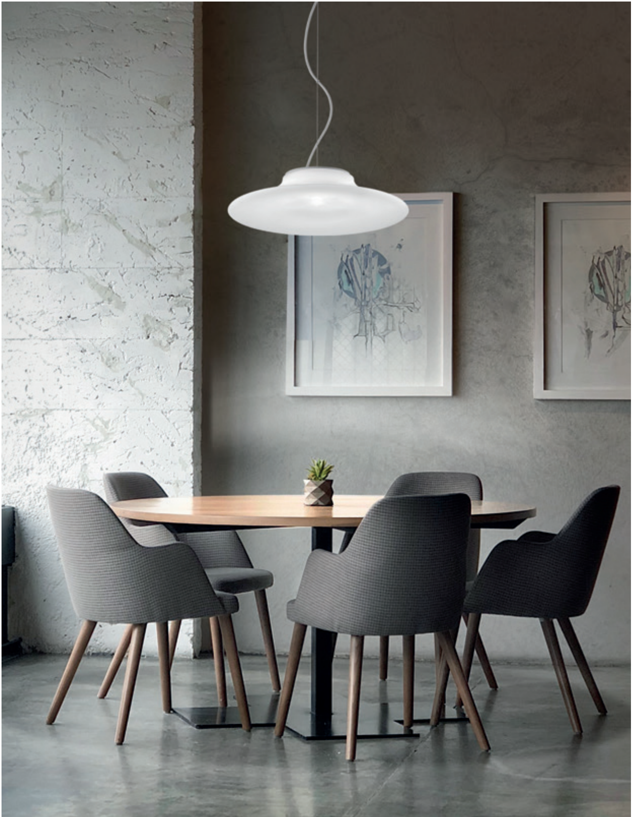
Incanto SP 2