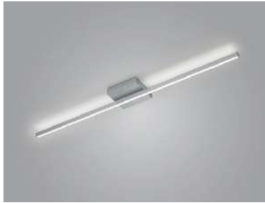
91.366.xx 44 W LED, 5.089 lm, 2.700 K EEL-F