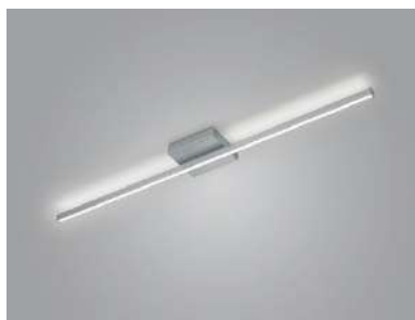
91.366.xx 44 W LED, 5.089 lm, 2.700 K EEL-F