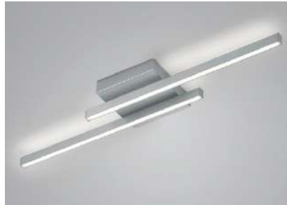
91.362.xx 38 W, 4.314 lm, 2.700 K EEL-F