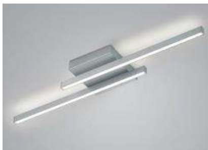
91.362.xx 38 W, 4.314 lm, 2.700 K EEL-F